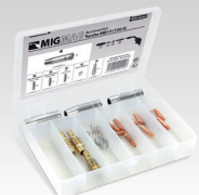
Coffret torche MB15 (150 A) 041226