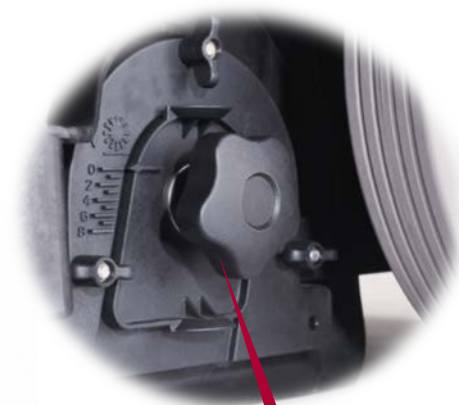
Réglage et démontage des balais simple et sans outils