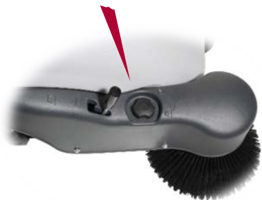
Balai latéral à entraînement électrique sans courroie