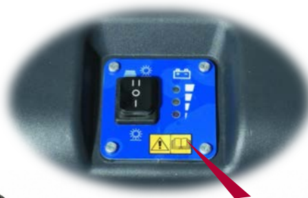
Commandes intuitives par icônes et indicateur de charge de batterie