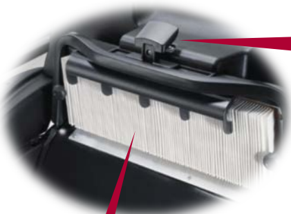
Filtre lavable en polyester